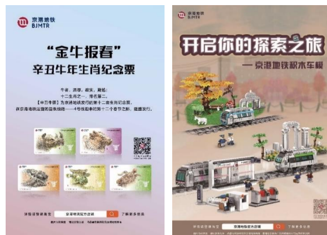
京港地铁公司文创产品