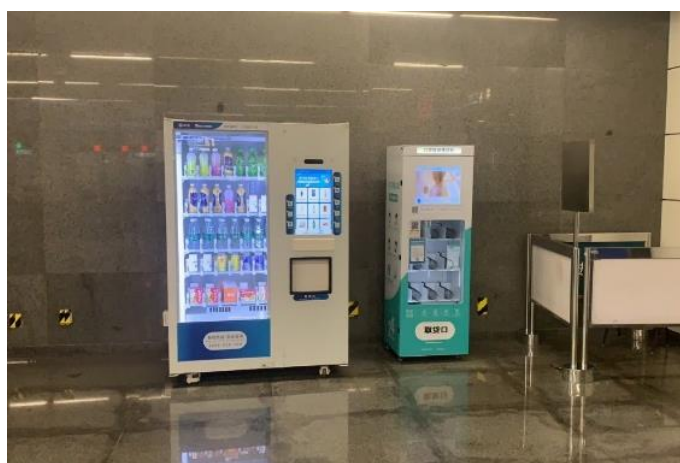
综合售货机与口罩售卖机